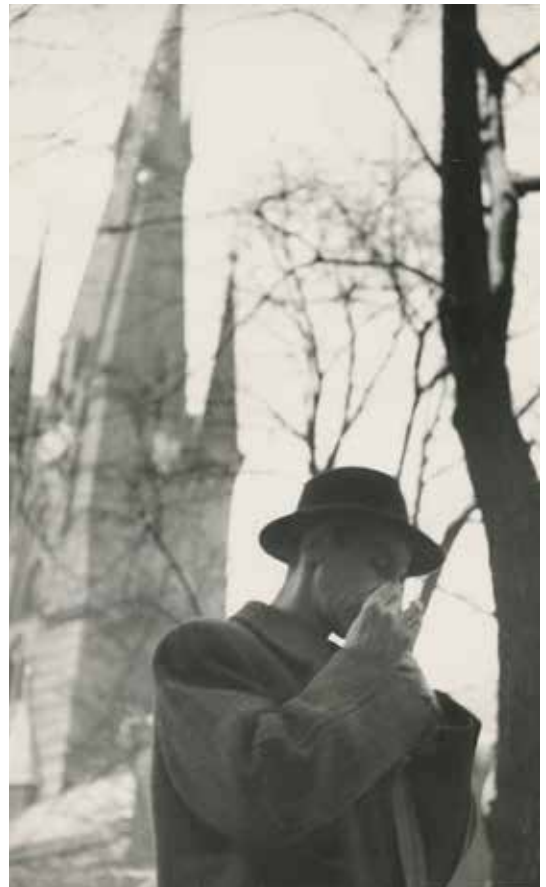
Nils Ferlin vid Klara kyrka.

Men högt över stjärnornas röda skum och marknadsgyckel och bång där går i ett öde och ödsligt rum omhöljd av sitt eget silentium Vår herre sin väktargång.