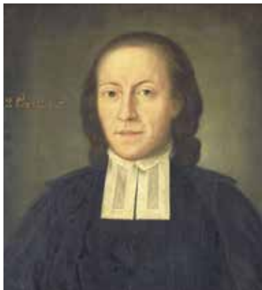
Henric Schartau (1757-1825).